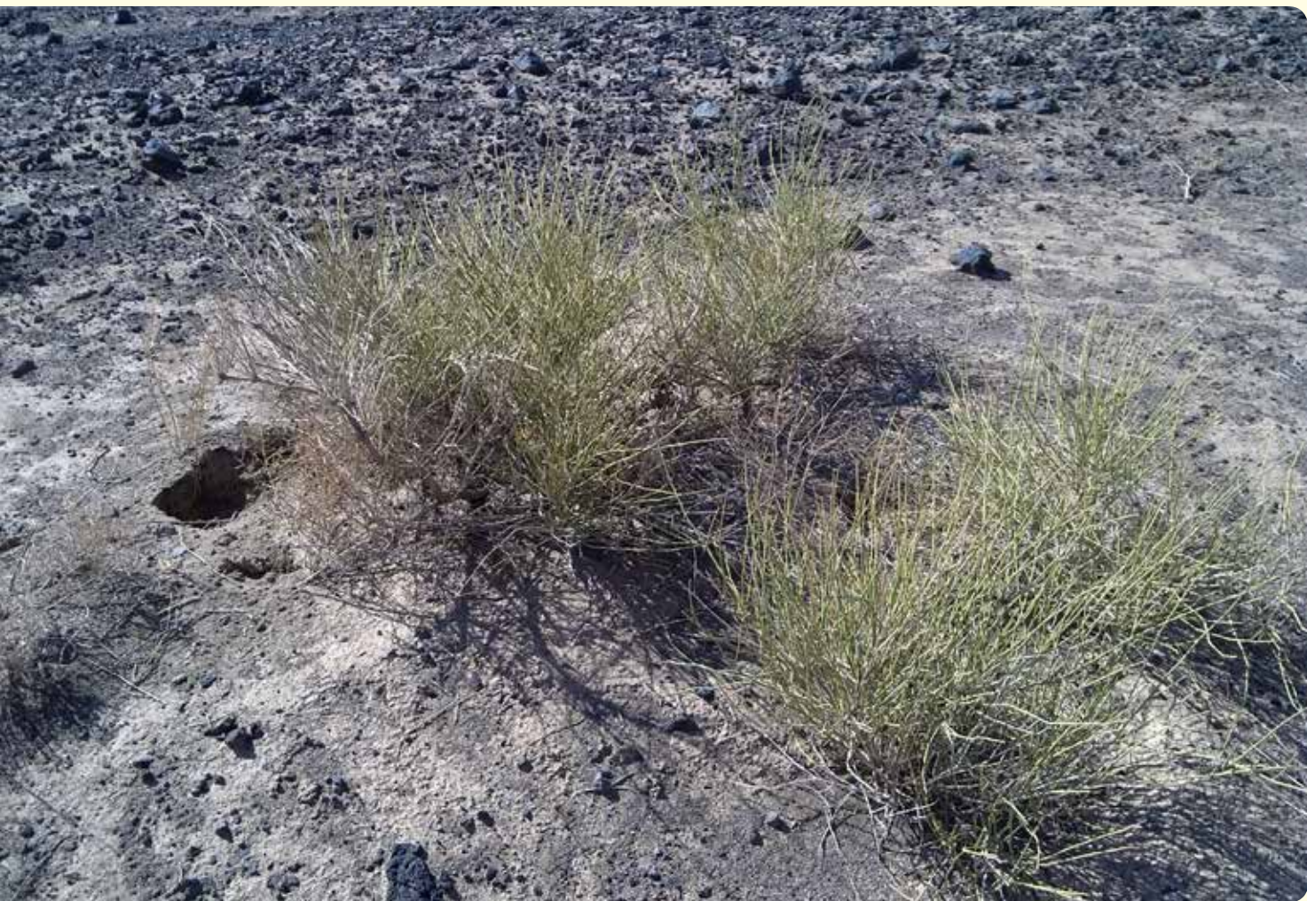
شکل ۶- گونه Ephedra strobilacea در حاشیه کوه سیاه