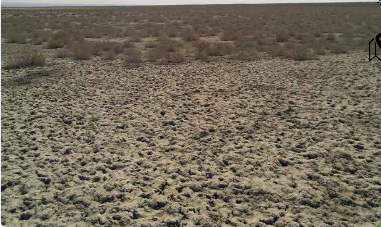
شکل ۹- پسر روی اجتماع Haloenemum strobilaceum و تبدیل آن به اراضی بدون پوشش بر اثر خشکی تالاب گاوخونی

تالاب و افزایش شوری مهم ترین تهدیدات فیزیکیوشیمیایی هستند. همچنین نابودی زیستگاه‌های حیات وحش تهدید مهم بیولوژیک منطقه است و نهایتاً برداشت بی‌رویه از آب زاینده‌رود و آلودگی آب تالاب ناشی از فعالیت‌های بشری مهم ترین تهدیدات اقتصادی و اجتماعی در این محدوده به‌شمار می‌روند.