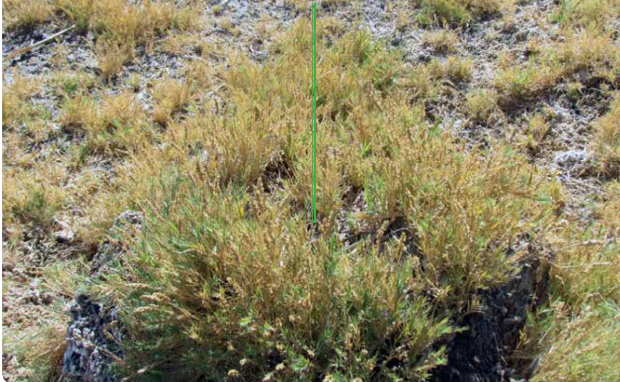
شکل ۱۰- گونه گیاهی Aeluropus littoralis در بخش غربی تالاب گاوخونی در شرایط پرآبی تالاب (عکس از محمدتقی فیضی)