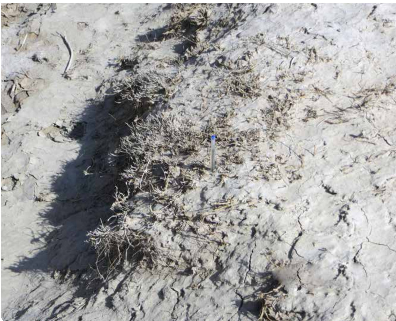
شکل ۱۱- خشک شدن کامل گونه Aeluropus littoralis بر اثر خشکی تالاب در بخش‌های شمالی و غربی