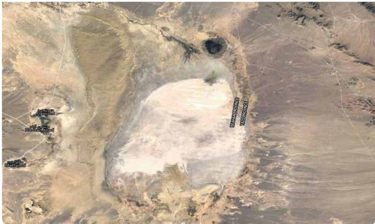
شکل ۲- آخرین تصویر ماهواره‌ای تالاب گاوخونی (گوگل، ۱۳۹۶)

تالاب گاوخونی به‌عنوان یکی از دریاچه‌های بارانی و چاله‌های تراکمی کواترنر از جایگاه ویژه‌ای در میان قلمروهای دوران چهارم ایران برخوردار