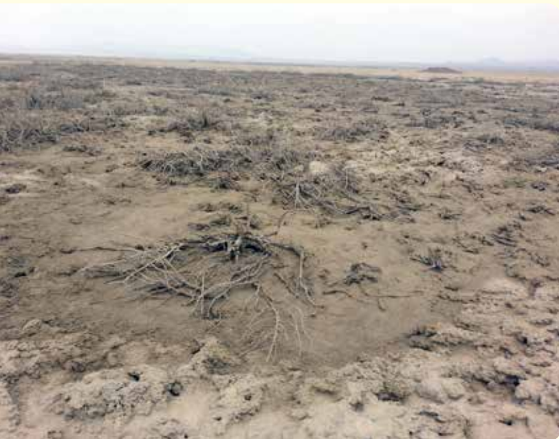
شکل ۸- از بین رفتن تیپ گیاهی Halocnemum strobilaceum - Aeluropus littoralis در بخش شمالی تالاب گاوخونی