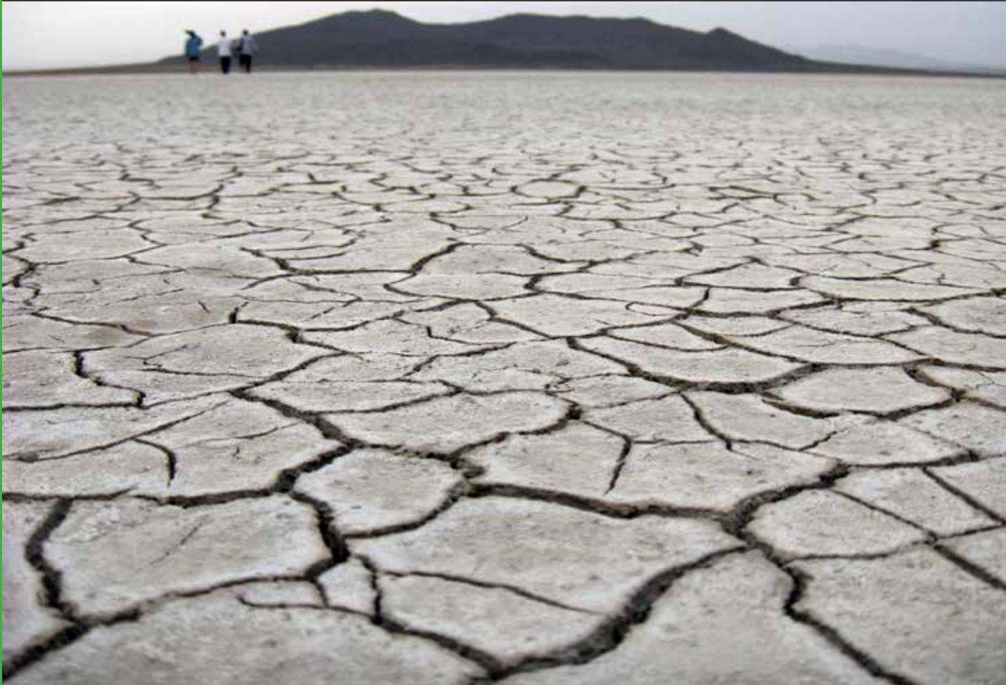
شکل‌های ۳ و ۴- منظره عمومی تالاب گاوخونی و سیاه‌کوه در زمان پرآبی و اکنون