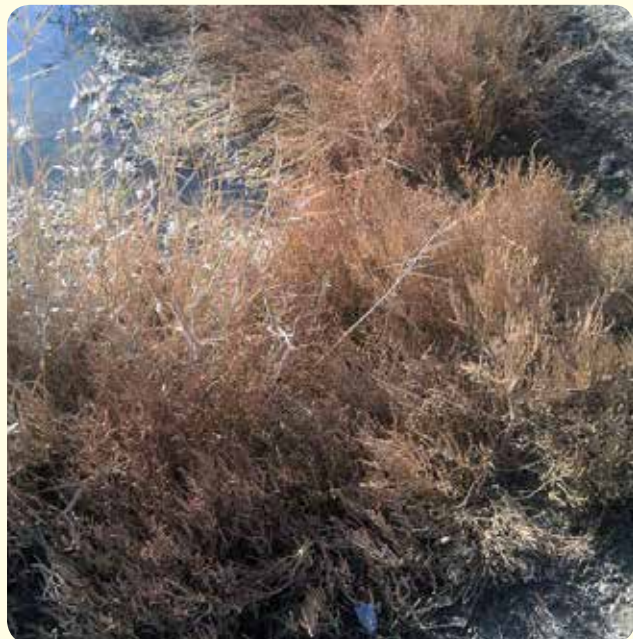
شکل ۷- گونه Salicornia persica در حاشیه تالاب گاوخونی