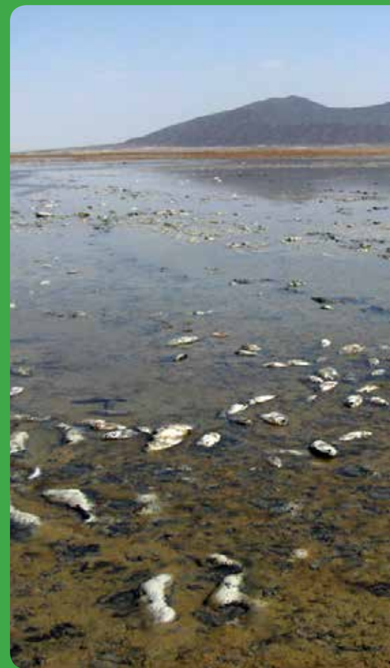
شکل ۱۴- جریان سبب فاضلاب شهری و کشاورزی با آلودگی بسیار بالا در بخش‌هایی از تالاب

صالحی، ر.، غفوری، م.، لشکری پور، غ. و دهقانی، م.، ۱۳۹۲، بررسی فرونشست دشت مهیار جنوبی با استفاده از روش تداخل‌سنجی راداری. فصلنامه علمی، پژوهشی مهندسی آبیاری و آب، سال سوم، شماره ۱۱: ۴۷-۵۷. علوی، م.، و بهمن، ص.، ۱۳۸۷. تنوع زیستی تالاب گاوخونی، مجموعه مقالات اولین همایش منطقه‌ای اکوسیستم‌های آبی داخلی ایران، ۱۱ صفحه.